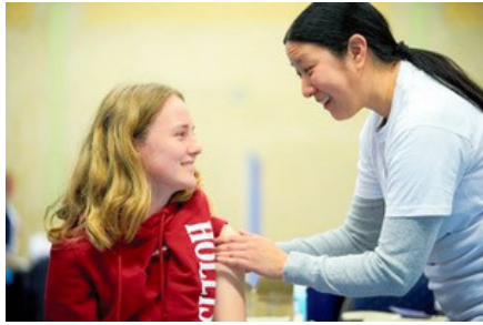
欧州では子どもの予防接種を拒否する親が増えている